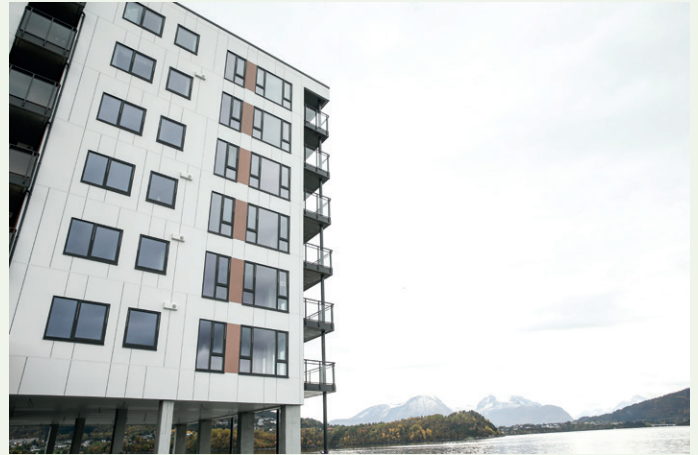
På andre siden av fjorden ser vi Sula og Sunnmørsalpene i Ørsta-området.