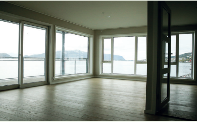
Leiligheten på 95 kvadratmeter mot sjøen har utsikt både mot sør og vest.