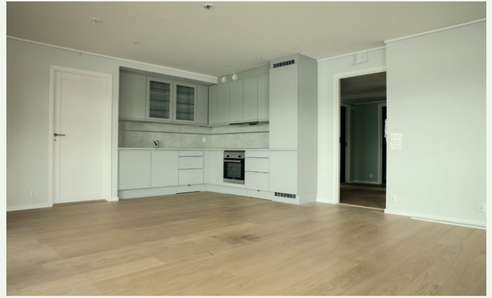
En av leilighetene i bygget.