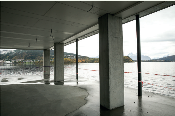
En kvalitet ved bygget er denne overbygde kaia på 200 kvadratmeter som blir fellesområde for sameiet.