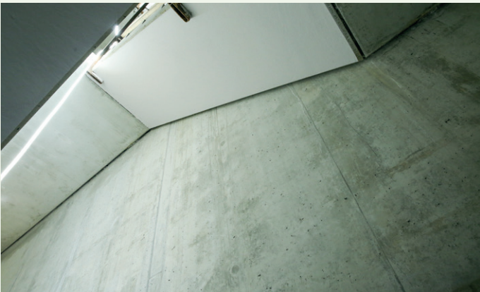
Det er to trappeløp i bygget med eksponert betong og elementtrapper.