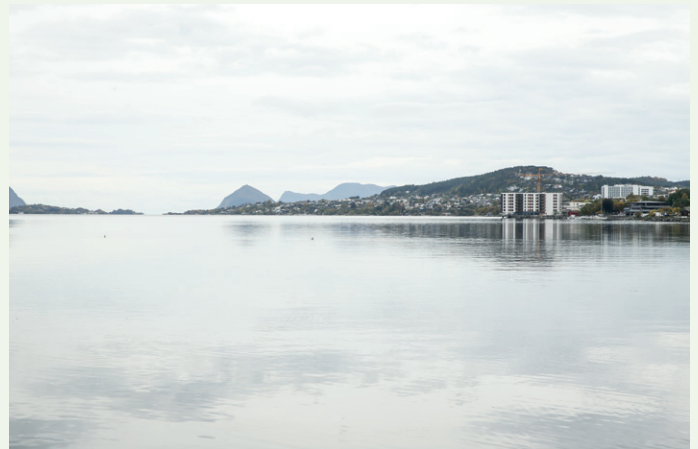
Boligprosjektet Borgundfjorden Panorama er blitt et landemerke i indre bydel i Ålesund.

og malt. HTH har levert kjøkken og garderober, mens dører og skyvedører er levert av Swedoor. Det er to trappeløp med prefabrikerte betongtrapper levert av Cementprodukt. Heisen er levert av Heisplan, sier Johnsen om konstruksjon og materialvalg.