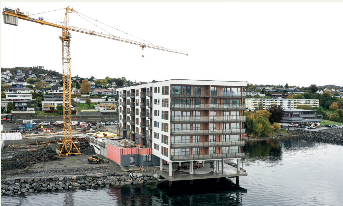
Byggetrinn 1 i Borgundfjorden Panorama sett fra sørvest. En cirka 3.000 kvadratmeter stor parkeringskjeller for byggetrinn 1 og 2 er en del av første byggetrinn. Byggetrinn 2 kommer over parkeringskjelleren til venstre for bygget som er kommet opp. Til sammen blir det 103 leiligheter i prosjektet når alt er ferdig. Kjøpesenteret på Moa ligger bak haugen i bakgrunnen.

punktet i størrelse fra 36 til 92 kvadratmeter, fra ett til fire rom. Leilighetene som er slått sammen er blitt 135 kvadratmeter. Ifølge anleggsleder Johnsen varierer prisnivået fra 60.000 til 80.000 kroner per kvadratmeter alt etter beliggenhet og attraktivitet.