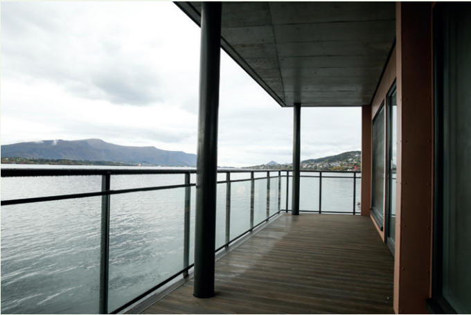
Du kan henge fiskesnøret ut fra disse terrassene på leilighetene i fronten. Vi skimter fjellet Sukkertoppen i ytre bydel i bakgrunnen.