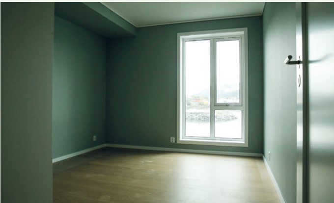
Et av to soverom i den 80 kvadratmeter store leiligheten.