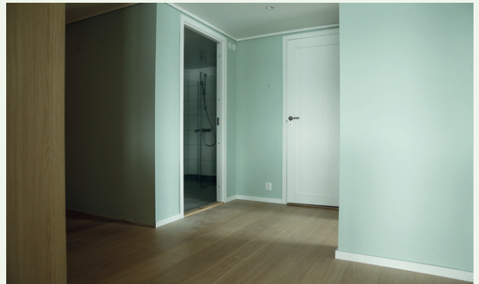
Gangområdet i toromsleiligheten på 80 kvadratmeter.